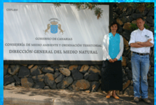
Foto: Bij de overheidsorgaan in Tenerife. Hier zijn ze verantwoordelijk voor het verstrekken van vergunningen.

Deze tijd in Las Palmas was gereserveerd voor oefenen met de apparatuur, het leggen van contacten, en het verkrijgen van vergunningen om met de dolfinen en walvissen te zwemmen en deze te filmen. Want deze beschermde diersoorten mag je gelukkig niet zo maar benaderen. Normaal, hadden ze ons verteld, duurt het 15 dagen om deze vergunningen te krijgen. Dus begonnen we acht weken geleden met goede moed aan dit hachelijke avontuur. En eind maart, nadat ze ons voor de vierde keer toegezegd hadden dat de vergunningen er zouden zijn, verontschuldigde ze zich met de vraag of we het verzoek van de universiteit nog een keer wilde sturen... Maar nu is er beloofd dat de vergunningen er in 15 dagen zullen zijn. We moeten dan wel de vergunningen ophalen op Tenerife. We zullen het zien.