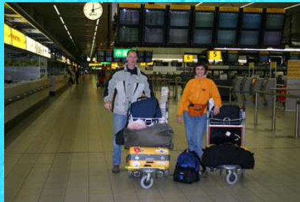
Foto rechts: De eerste fase begint met een vlucht vanuit Nederland naar Las Palmas zeven maanden geleden. Veel is sindsdien gebeurd.

Wat wij geconstateerd hebben over de slechte staat van de oceaan, de toewijding van de mensen in het veld en gebrekkige informatie bij het algemene publiek, zijn de factoren die ons hebben doen inzien dat ons werk noodzakelijk is. Het zijn die signalen waardoor wij hebben besloten met ons werk door te gaan. Volgende maand begint de tweede fase van Morganonline: de financiering en planning om in de volgende 5 jaar de wereld te ronden en verslag te doen van de mensen die werkzaam zijn in natuurbehoud.