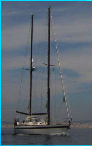
Fotos onder: aan boord de Anacauna (boven); en Ernie krijgt les over de Europhlukes Database.